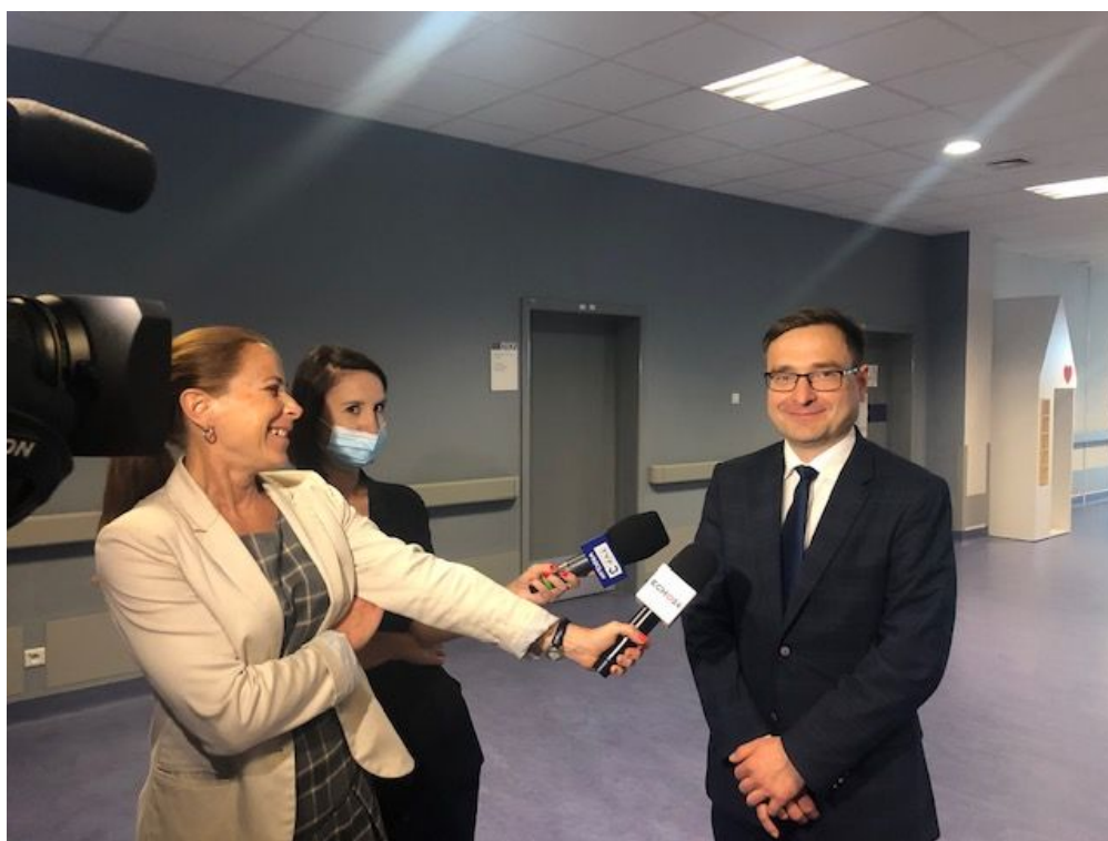
Marcin Krzyżanowski, wicemarszałek województwa dolnośląskiego zapewnia, że nowy rezonans będzie służył dzieciom z całego Dolnego Śląska