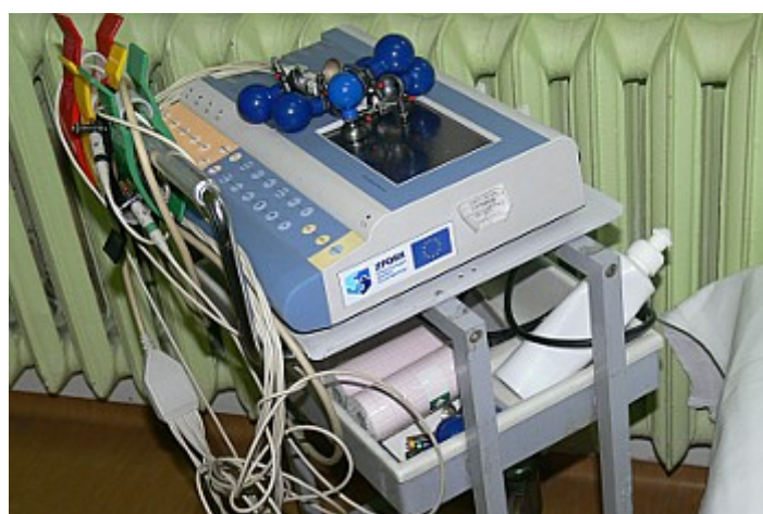
Zdjęcie nr 4. Aparat EKG