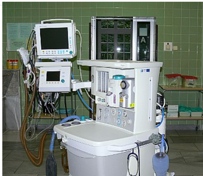
Zdjęcie nr 3. Respirator stacjonarny