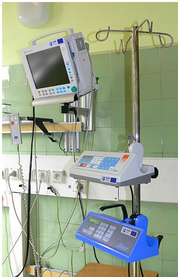
Zdjęcie nr 5. Monitor funkcji