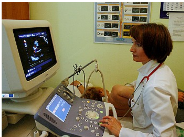
Zdjęcie nr 1. Aparat do USG serca

Całkowita wartość projektu: 1 439 810,00 zł