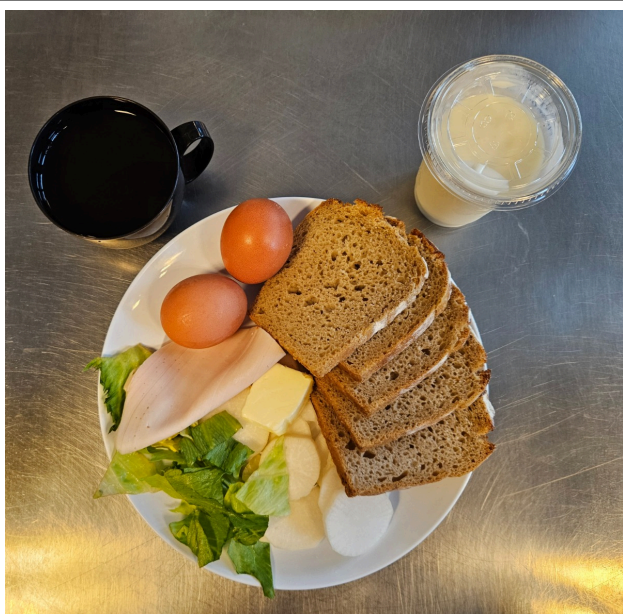
Śniadanie - dieta z ograniczeniem łatwo przyswajalnych węglowodanów

Maślanka Chleb razowy żytni z masłem, jajko, rzodkiew, sałata lodowa Herbata czarna