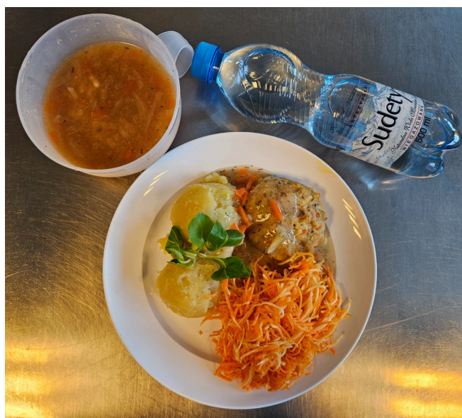
Obiad - dieta z ograniczeniem łatwo przyswajalnych węglowodanów