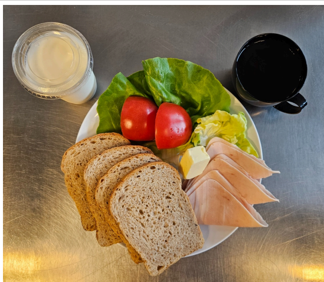
Śniadanie - dieta podstawowa

Maślanka Chleb graham z masłem, szynka delikatesowa, pomidor, sałata lodowa Herbata czarna