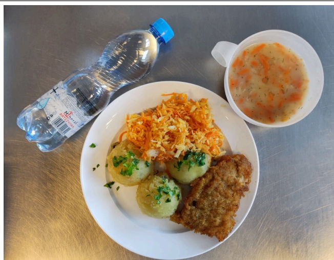
Obiad - dieta podstawowa

Kefir Chleb razowy żytni z masłem, szynka drobiowa, pomidor, sałata masłowa Herbata czarna