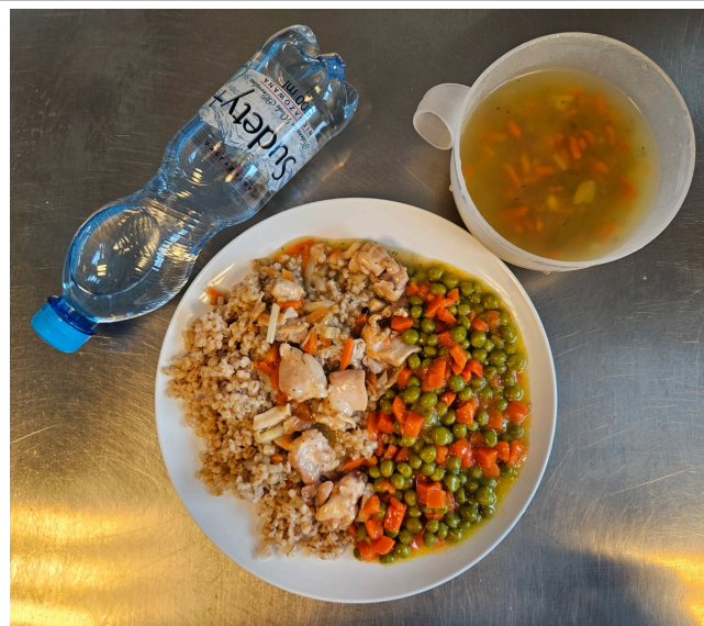
Obiad - dieta łatwostrawna

Maślanka Chleb graham z masłem, szynka delikatesowa, pomidor, sałata lodowa Herbata czarna