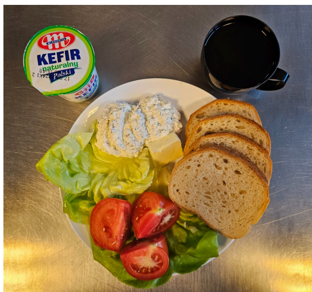
Śniadanie - dieta łatwostrawna