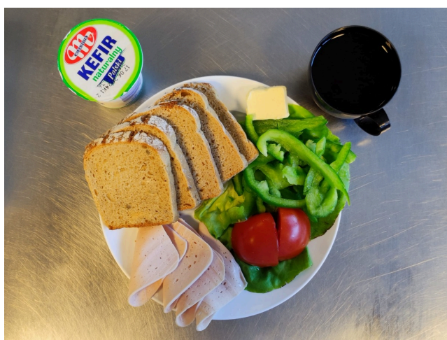
Śniadanie - dieta z ograniczeniem łatwo przyswajalnych węglowodanów

Kefir Chleb razowy żytni z masłem, szynka drobiowa, pomidor, sałata masłowa Herbata czarna