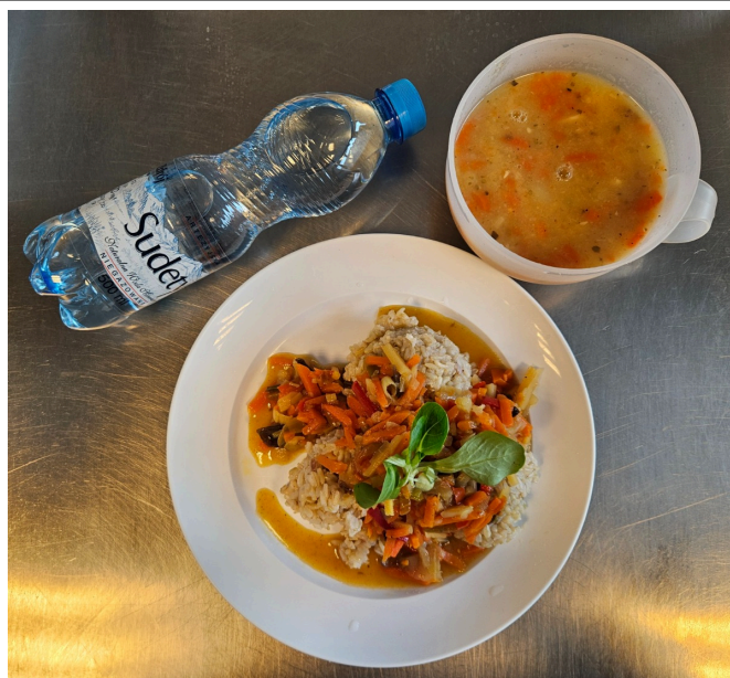
Obiad - dieta podstawowa

Maślanka Chleb razowy żytni z masłem, jajko, rzodkiew, sałata lodowa Herbata czarna